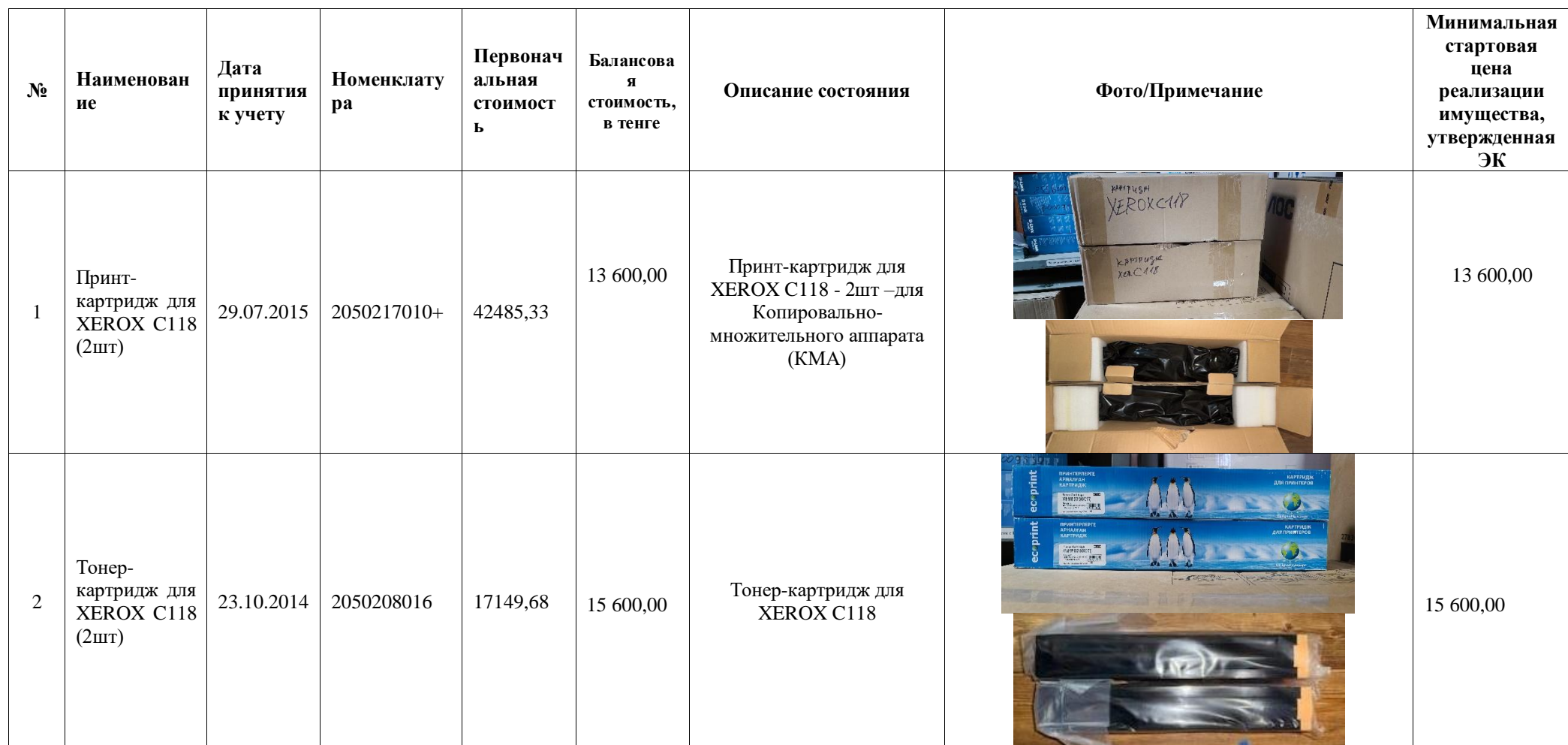
Фото и описание реализуемого имущества Западно Казахстанского областного филиала АО «ЕНПФ»